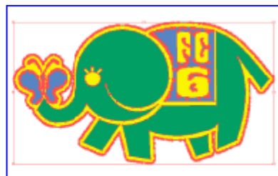
Extracting outline of the image automatically!