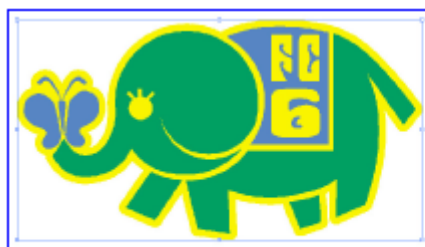
From bitmap data without path data

Cortar línea se pueden crear fácilmente de los datos de la imagen que no pudo ser creado hasta ahora.